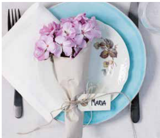
Geranien bringen Sommerstimmung auf den Tisch und sorgen für gute Laune.

Sie sind noch auf der Suche nach einem außergewöhnlichen Blickfang für Ihre Gartenparty? Dann haben wir zu guter Letzt noch eine DIY-Variante mit Glamour: Geranien in Goldäpfeln! Auch diesen Blickfang im urban-modernen Style können